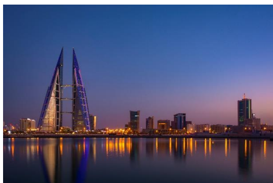
Hải cảng Manama về đêm