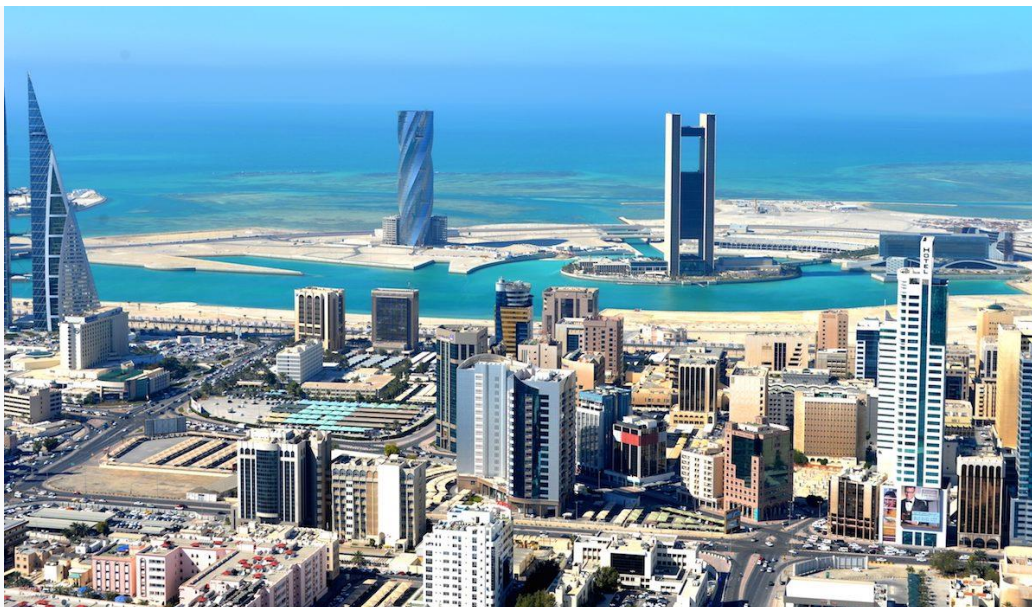
Quang cảnh thành phố Manama