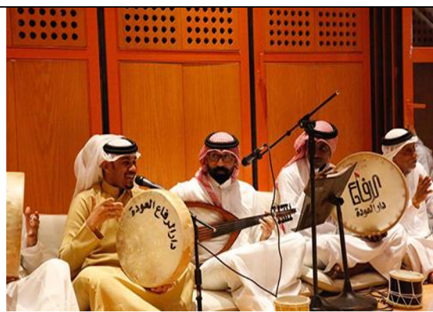
Nhạc cụ Bahrain

Hồi giáo là tôn giáo chủ yếu, và người Bahrain khoan dung trước việc hành lễ của các tín ngưỡng khác. Các quy tắc liên quan đến trang phục nữ giới thường thoải mái hơn so với các quốc gia lân cận; trang phục truyền thống của nữ giới thường bao gồm áo hijab hoặc abaya. Trang phục truyền thống của nam giới là thobe kèm với khăn trùm đầu truyền thống như keffiyeh, ghutra và agal, song trang phục phương Tây được phổ biến.