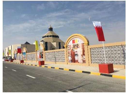
Nhà thờ chính tòa Bahrain

Bahrain còn có một cộng đồng Do Thái giáo bản địa với số lượng là 37 công dân Bahrain (2010). Dòng di dân và công nhân nhập khẩu từ Ấn Độ, Philippines hay Sri Lanka, tỷ lệ người Hồi giáo tại Bahrain suy giảm trong những năm gần đây. Theo điều tra nhân khẩu năm 2001, 81,2% cư dân Bahrain là người Hồi giáo, 10% là người Cơ Đốc giáo, và 9,8% tin theo Ấn Độ giáo và các tôn giáo khác. Điều tra nhân khẩu năm 2010 ghi nhận rằng tỷ lệ người Hồi giáo giảm xuống còn 70,2%. Các quan chức chính phủ Bahrain bác bỏ các báo cáo từ phái đối lập cho rằng chính quyền muốn thay đổi tình hình nhân khẩu của quốc gia bằng những người Syria Sunni nhập tịch. Tín đồ Baha'i chiếm khoảng 1% tổng dân số Bahrain.