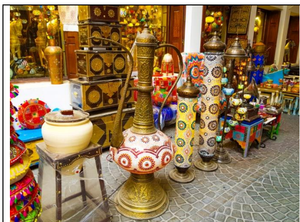
Sản phẩm đồ gốm Bahrain