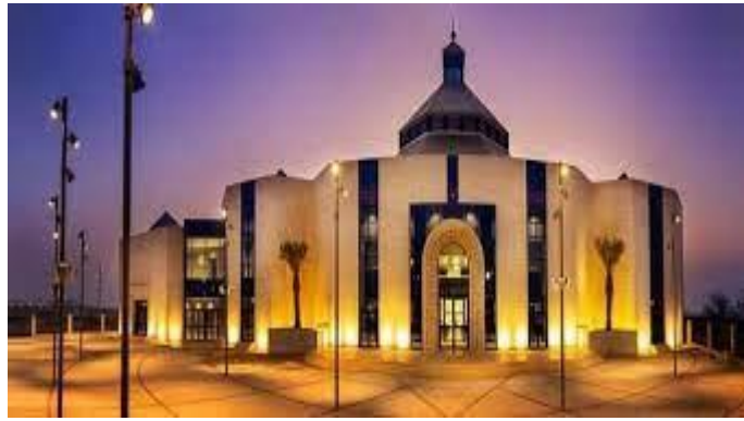
Nhà thờ chính tòa Bahrainnơi ĐTC thăm viếng