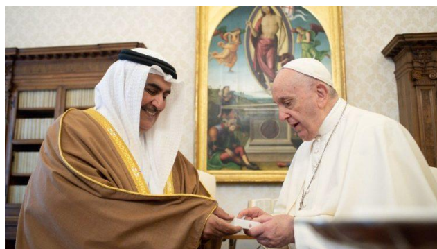
Vua Shaikh Hamad bin Isa Al Khalifa, và ĐTC

Bahrain nằm dưới quyền cai trị của Hoàng gia Al-Khalifa, một nền quân chủ lập hiến do quốc vương đứng đầu, quốc vương hiện nay là Shaikh Hamad bin Isa Al Khalifa. Quốc vương Hamad có quyền lực hành pháp rộng lớn, bao gồm cả việc bổ nhiệm thủ tướng và các bộ trưởng, chỉ huy quân đội, chủ tọa Hội đồng Tư pháp Tối cao, bổ nhiệm Hội đồng Cố vấn của nghị viện và giải tán Hội đồng Đại diện.